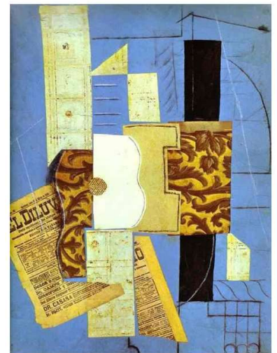
Pablo Picasso, The guitar (El diluvio), Spring 1912, MoMA